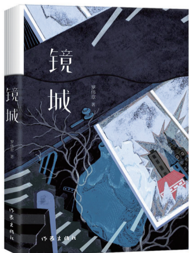
作者:罗伟章 出版社:作家出版社 出版时间:2024年6月

这是著名作家罗伟章近年来几部优质中篇小说合集，包括《镜城》《逆光》《将近两千年前的一桩悬案》《从旬开始》《白鸟》《名人》，均发表在各文学刊物。罗伟章的中篇小说彰显出他强大的文学创作能力，语言丰富辛辣有个性。他的中篇作品较多关注底层民众生活，关注那些被时代大潮忽略的个体，对普通人的人生进行真实描摹，凸显出强烈的批判精神和深切的同情，充满对现实的观照。