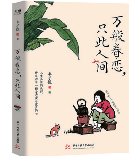
作者：丰子恺 出版社：华中科技大学出版社 出版时间：2024年12月

丰子恺认为，世间事物的真相，只有孩子们能最明确、最完整地见到。在《从孩子得到的启示》里，4岁的华瞻将战乱中的逃难记忆，幻化成“坐汽车看大轮船”的浪漫旅程。这种孩童特有的认知错位，恰恰是丰子恺眼中最珍贵的生命智慧。当成人人在枪炮声中惶惶不可终日时，孩子却在假山中发现新天地，在废墟里构建出轮船与帆船的童话世界。这种对世界本相