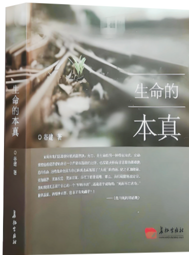
作者:谷建 出版社:长征出版社 出版时间:2017年2月

人们评论谷建的杂文,首先肯定的是他的立场对头,正视现实。他主张杂文要有党性,他的立足点始终站在时代的前沿,站在党和国家及人民利益的高度,为改革开放鼓呼,为弊绝风清使力。有段时期,一些角落冒出一股否定民族英雄的邪风,谷建洞幽烛微看出端倪,先后写出《如果连邱少云都是假的》《当怀疑变成了谣言》,以及《由阿里想到英雄崇拜》等一系列杂文,以不可辩驳的逻辑澄清事实、弘扬正义,受到广大读者称赞。而当一些人信仰动摇、行为迷离时,他又适时写出《有一种死亡