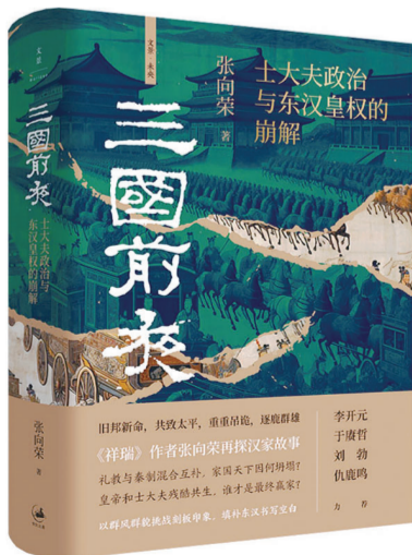
作者:张向荣 出版社:上海人民出版社 出版时间:2024年6月

《三国前夜》主要讲述被新朝洗礼过的“第二汉朝”是什么样子,儒学在培养“哲人王”的道路上失败后怎样延续自己的文化生命。作者尝试以“群像”描写呈现这一时期士大夫、宦官、宗室以及群雄之外普通人的观念乃至时代风貌,进而追问:东汉的皇权虽然崩解了,但“秦制—儒教”这一结构并未随之覆灭,它又如何寄托在新兴的儒家士大夫身上,得以在后世不断重建?