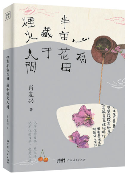
作者:肖复兴 出版社:广东人民出版社 出版时间:2024年2月

读着肖复兴先生的文字,你可以感知到他有一颗感性的心、一种质朴真诚的情怀。在这本书中,所有的人物、所有的故事,都是我们日常所见,因而阅读时会感同身受。他把生活中最温暖的故事讲给读者听,把那些值得铭记的生活片段用寻