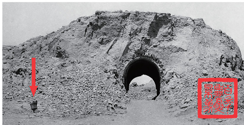
1923年，甘盐池西门景象。

据震后靖远县的报告记载（当年甘盐池属靖远管辖）：“东区之干盐池，房屋无一存者。”强烈的地震将甘盐池堡劈开一道巨大的地裂缝：自城墙东南角斜贯而入，撕裂整座城池直抵西北角，继而向西延伸，甚至穿过了盐湖底部。城内屋舍几乎悉数倾颓，居民死伤极为惨重。尤其许多穷困人家在城墙上挖土为窑穴居其中，而地震造成多处墙垣坍塌，窑洞随之覆灭，受难者无数。