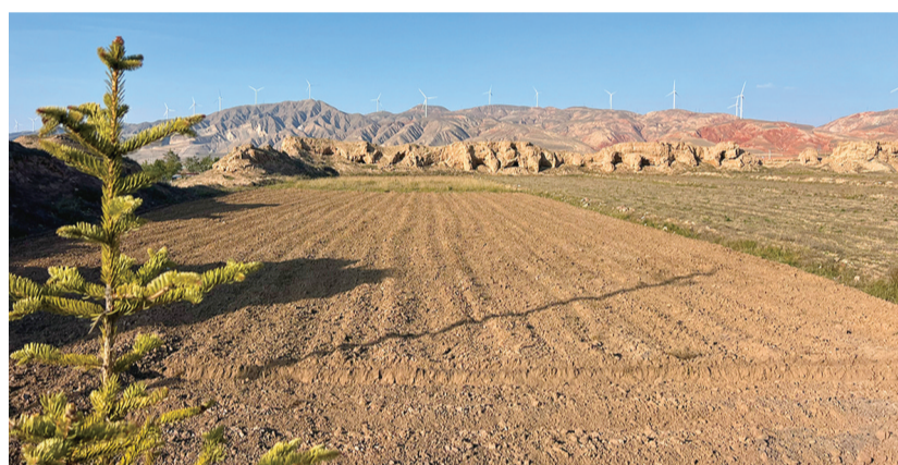
2025年10月29日，本文作者摄于甘盐池。

聆听甘盐池的老人们追述往事之后，我在城内徘徊许久。历史的风霜与时代的变迁，在此交织成刻画在大地上的印记。夯土筑就的城墙宁静地诉说着悠远的历史，而断壁残垣则凝