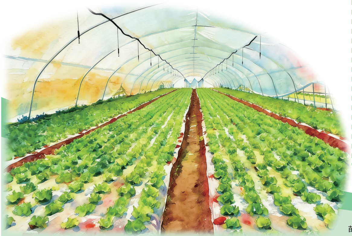
苗晨：制图(AI辅助生成)

近年来，农村群众逐渐打破“猫冬”的习惯，利用冬闲时间拓宽增收途径。银川市聚焦农民冬闲时节就业增收，通过政府引导搭平台、产业升级拓空间、劳务协作拓渠道，推动传统冬闲期向“增收期”“成长期”转变，让农民在冬日里忙有所获、忙有所成，绘就了一幅乡村振兴的冬日暖心图景。