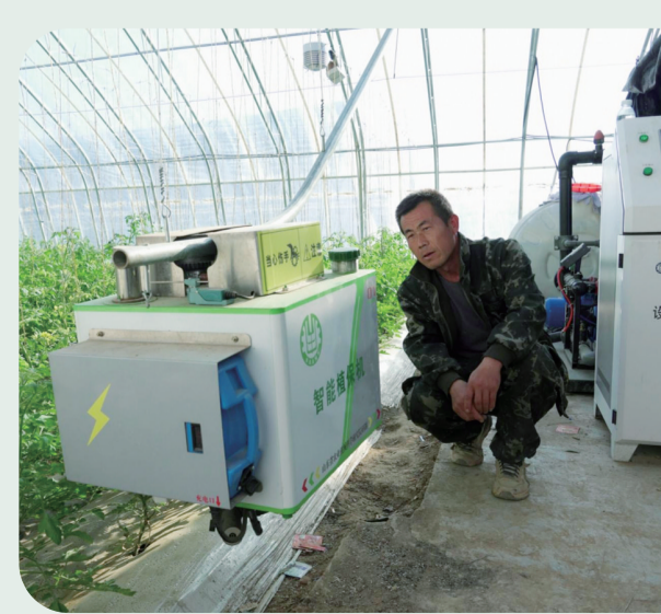
村民调试智能植保机。