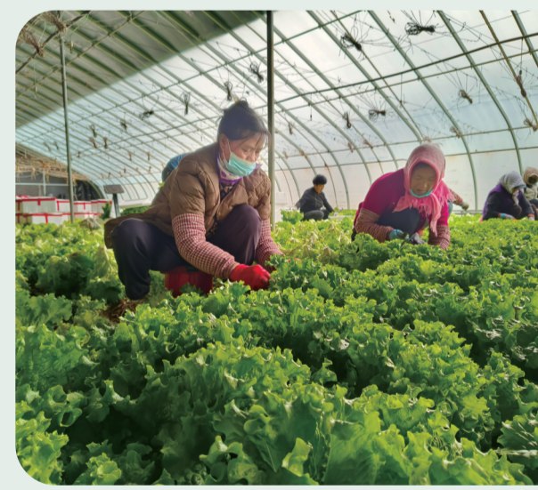
村民在大棚采摘新鲜蔬菜。

设施农业有“四季工”，跨省输出有“技能工”，特色养殖有“产业工”，银川市用精准施策激活了冬日乡村发展的“一池春水”，让农民在冬忙中增收、在实干中成长，为乡村振兴注入了持久动力。