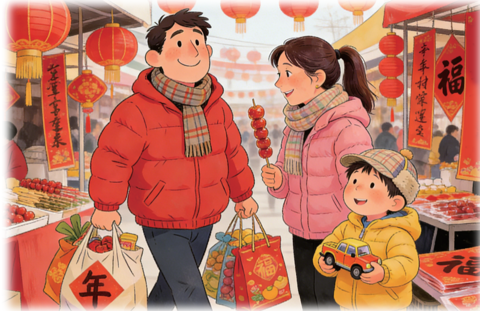
制图:苗晨(AI辅助生成)

春节越来越近了,各地纷纷启动年货促销活动:既有政府主导的网上年货节,也有商企、街道自发组织的夜市、社区集市,有文化年货集,也有针对脱贫村产品的定向销售……年货大集形态丰富多样,看得出,各地都在结合促消费、乡村振兴、结对帮扶等政策导向,将年货大集与校园帮扶、县域特产推广、夜经济等联动实施,呈现出年货+文旅、年货+帮扶等多元融合趋势。那么,如何让年货大集真正成为连接好物与居民的桥梁,释放更大消费活力?着眼银川实际,或可从三个纵深角度探索答案——