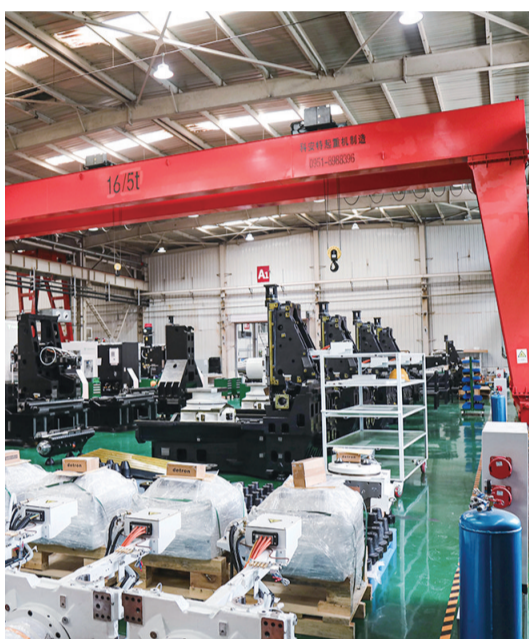
宁夏福斯泰智能装备有限公司的产品整装待发。

1月28日,记者从银川经开区了解到,近日,2026年宁夏回族自治区重点研发计划第一批拟立项项目陆续公示。银川经开区企业在高新技术和社会发展两大领域表现出色,共有24个项目入围,其中,高新技术领域20项、社会发展领域4项,覆盖新材料、高端装备制造、人工智能、生物医药、绿色低碳等多个前沿方向。