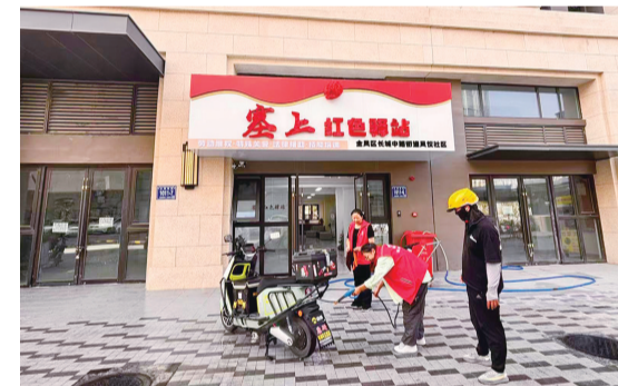
凤仪社区塞上红色驿站工作人员帮外卖小哥清洗电动车。

近年来,金凤区积极探索基层治理新路径,坚持以党建引领为核心,创新打造“专业社工+志愿服务”融合模式,聚焦“一老一小”、新就业群体、残疾人等重点服务对象,通过机制建设、队伍赋能、项目运作,构建起精准高效、充满温情的志愿服务体系,有效提升了基层治理的专业化水平与民生温度。