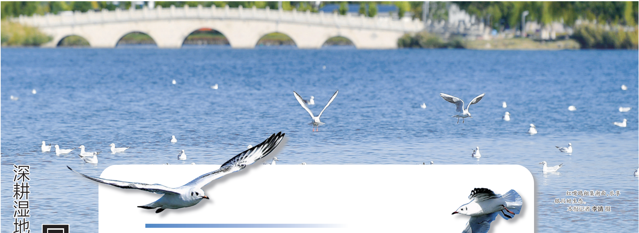
红嘴鸥翔集湖面，乐享银川好生态。