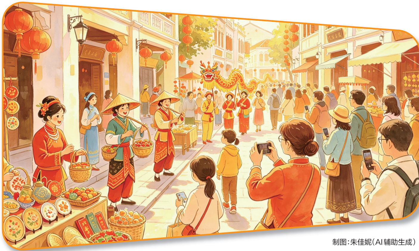
制图:朱佳妮(AI辅助生成)