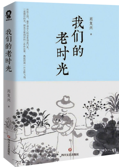
作者:肖复兴 出版社:四川文艺出版社 出版时间:2022年1月

作家的写作手法令人钦佩。他用白描笔法勾勒出回忆性文章的动人效果,比如关于盼望姐姐出现的片段:“是的,我接的并不是朋友,而是我的姐姐;不是她扑进我的怀抱,而是我扑进她的怀抱,是我跑过去,一下子扑进她的怀抱。”思念的心情一下子穿透纸页直抵读者内心,谁不感动呢?又如一位母亲送女儿远嫁