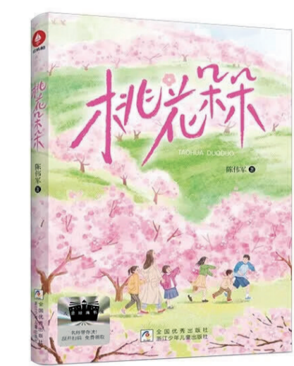
作者：陈伟军 出版社：浙江少年儿童出版社 出版时间：2026年6月

小说里的各色人物，鲜活又立体，每个人都闪烁着热情友善的光芒。驻村的沈迎放弃城市安逸生活，扎根乡村，修缮古建筑、扶持孩子们的曲艺梦想，用文化为乡村添彩；博士胡瀚返乡后，带领乡亲们栽种蜜桃，把荒山变成硕果累累的果园；支教老师文馨跨越千里奔赴深山，