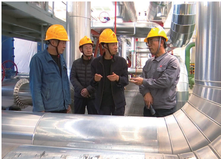
工作人员确保供热设备正常运行。

本报讯(记者 马鑫 班占洋)11月1日正式供暖第一天,供暖设备运行情况如何?供暖效果好不好?