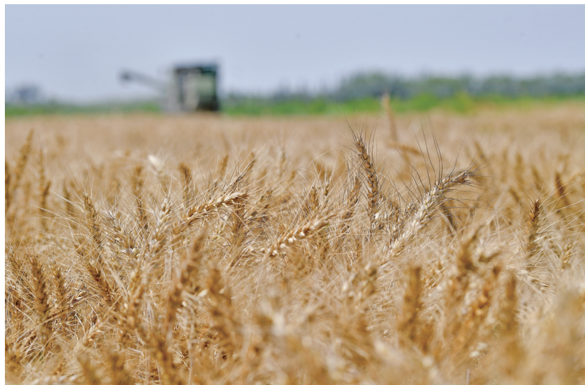
麦收时节。

又是一年麦收时节，在银川周边一望无垠的农田里，金黄的麦浪随风翻腾，一辆辆收割机开足马力，在麦浪中穿梭行驶，一幅丰收的画卷铺展在眼前。说到麦，就不能不提到五谷，它们不但为华夏儿女提供了营养，其字形中还蕴含着丰富的历史和深厚的文化。就让我们在银川市作家协会会员、古汉字研究爱好者张鑫华的解读下，一起走进粟、穀、麦、来这四个字构成的世界，了解每个字的演变过程，以及其中所蕴含的历史文化知识。