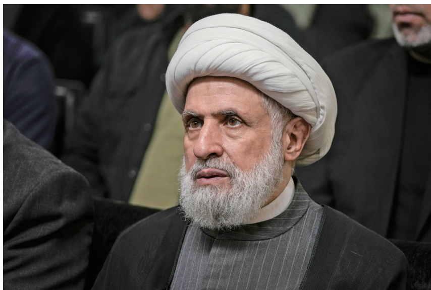
黎巴嫩真主党选举卡西姆为新任领导人。

加兰特当天视察以军北方司令部，声称以军已经摧毁真主党弹药库的大部分弹药，真主党的导弹和火箭弹“只剩下20%”，大规模发射的能力大大削弱。