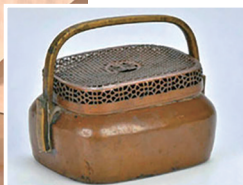
毛泽民用过的铜手炉。