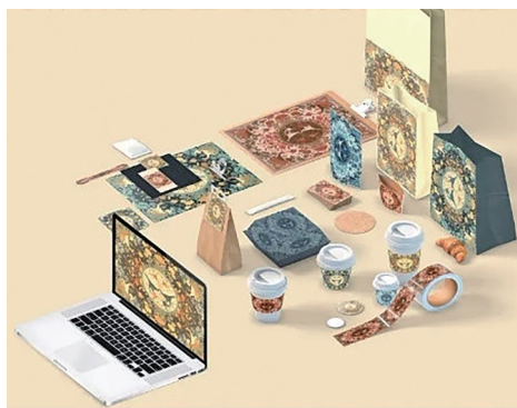
缠枝雅韵文创(铜奖)。