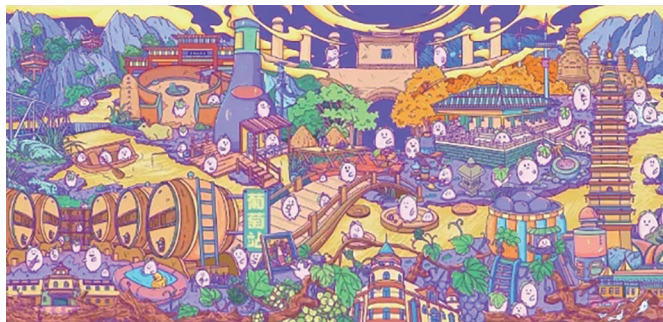
“萄”花源记”葡萄酒文化视觉设计(局部)。