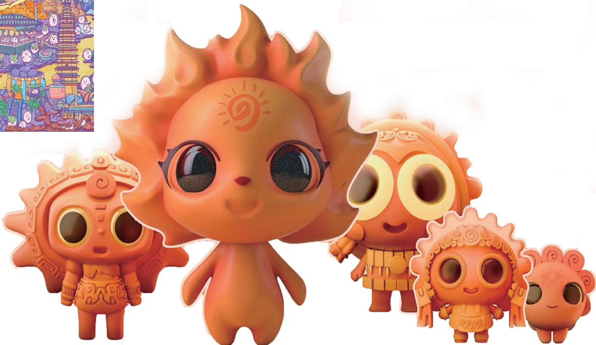
“烈焰神话”IP形象设计。