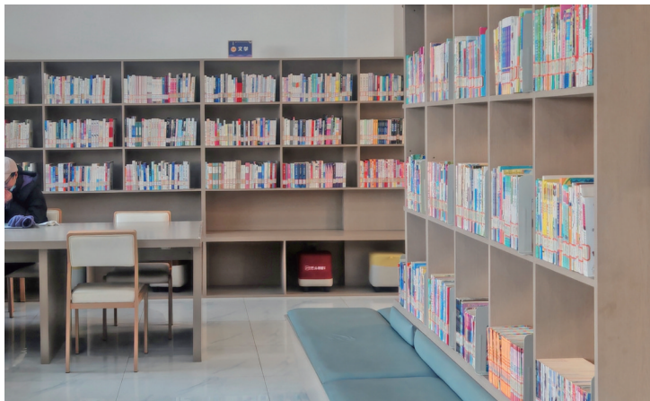
位于悠阅城附近的金凤悦书房一角。

近日,金凤悦书房与银川新华书店联合开创社区书店新模式,以崭新面貌融入市民生活,成为社区文化建设的重要一环。书房里不仅书籍品种丰富、更新迅速,更在功能上实现了多元化拓展,成为市民文化生活中的一道风景线。