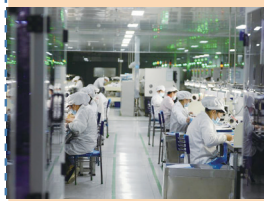
2024年11月10日,在池州市经济技术开发区,安徽安芯电子科技有限公司的工作人员在芯片AI检测车间工作。

分析人士认为,美国此前单方面挑起对华经贸摩擦,动摇了全球供应链;如今动辄出口管制和鼓励“回流”,是“用一个错误解决另一个错误”,其本质不过是一种为一己之私的政治操弄。