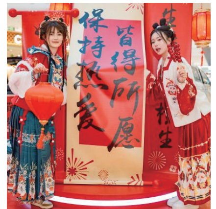
打造“欢喜中国年”主题氛围。

入了源源不断的动力,在行业内也形成了颇为影响力的深度运营案例。未来,银川兴庆吾悦广场也将持续为品牌奠定可持续发展的良好基础,为城市发展注入新活力。期待吾悦广场能与品牌携手,再次为广大消费者提供更加优质的购物体验。 炳蔚