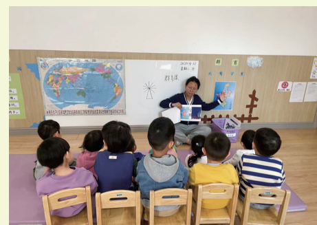
托育师为幼儿讲故事。