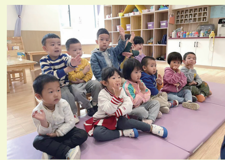
幼儿在家门口的托育机构享受到了科学照护。