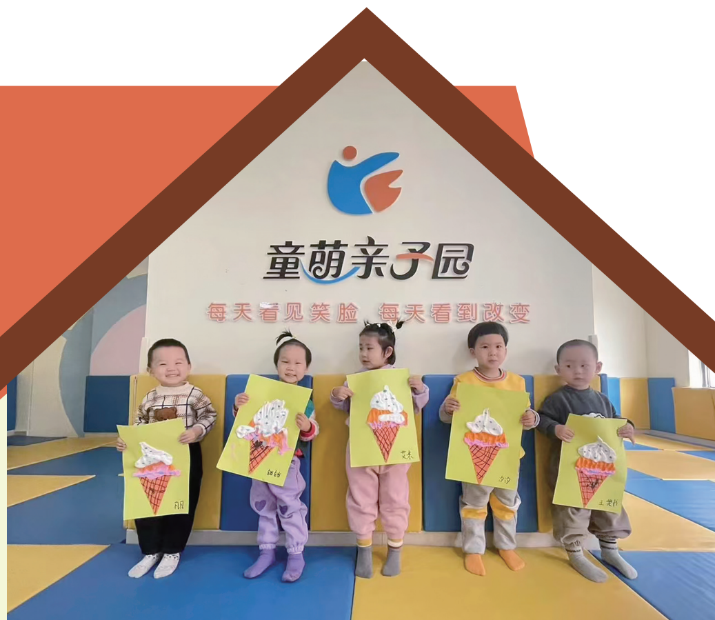
金凤区七子连湖社区的童萌亲子园。

记者在走访中发现，一些托育机构已经出现了“一位难求”的情形。但值得注意的是，引入第三方托育机构后，如何加强监管、如何提升服务，成为社区托育下一步亟待解决的问题。