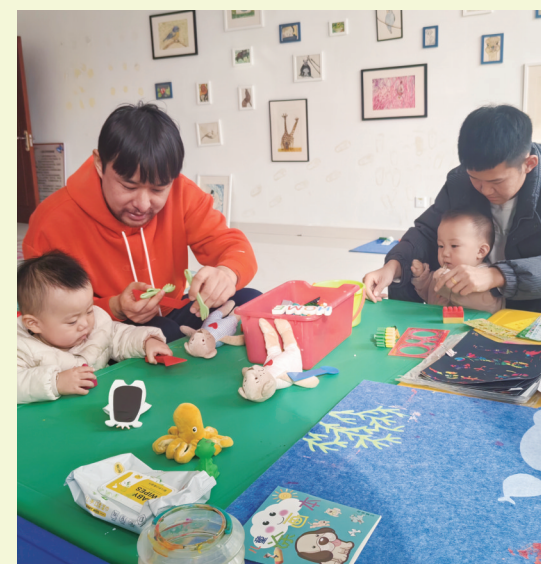
专家(图左)在社区科普育儿知识。