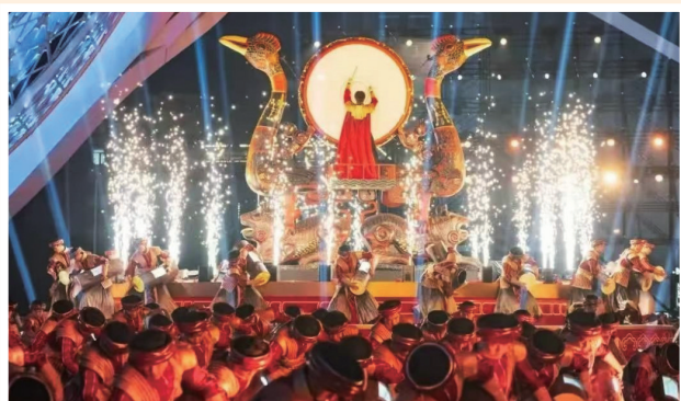
53名师生在春晚上表演节目。

1月28日晚8时,中央广播电视总台《2025年春节联欢晚会》汇聚歌曲、舞蹈、相声、小品、戏曲、武术、魔术等各类节目,与全球受众共享年味、同庆新春。北方民族大学音乐舞蹈学院53名师生惊艳亮相开场表演中武汉分会场的节目,以优美舞姿和饱满热情,向全国乃至全世界观众展示武汉这座“英雄城市”的独特魅力。