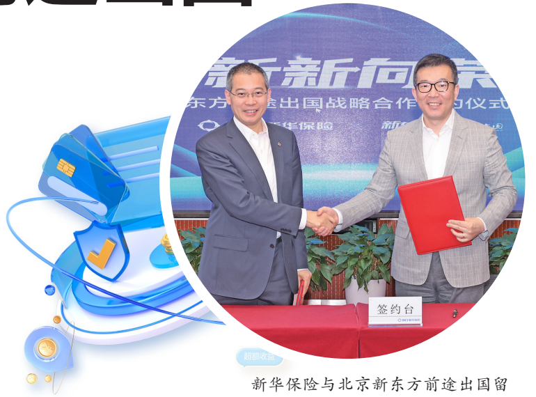
新华保险与北京新东方前途出国留学服务有限公司签署战略合作协议。