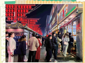
网红辣条店铺门前排起了长龙。资料图片