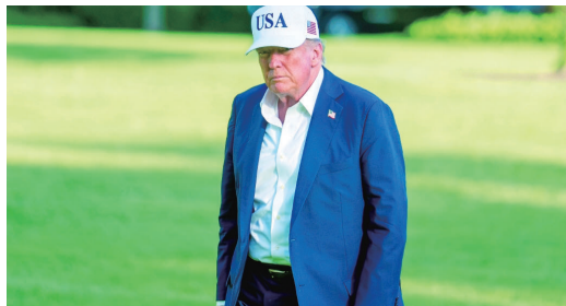
7月6日,美国总统特朗普乘直升机返回华盛顿白宫。