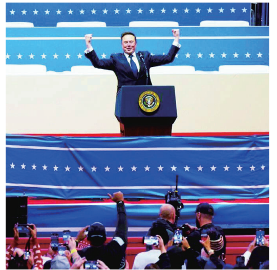
马斯克在美国首都华盛顿第一资本体育馆发表演说。