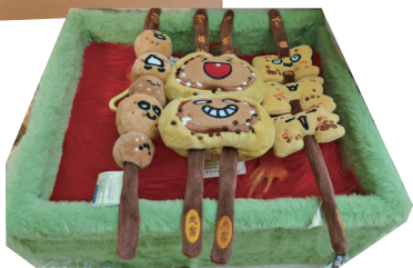
西夏陵特色文创产品。