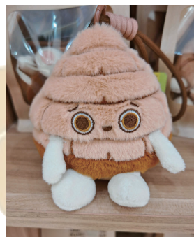
文创也可以萌萌的。

“挖掘出冰箱贴的设计，将盲盒的趣味性 with 实用性相结合，适合各年龄段人群。在这个过程中，消费者不仅收获了文创产品，还学习了西夏文物知识，实现了寓教于乐的目的。”马铭说，当消费者拿起小铲子，小心翼翼地挖掘盲盒时，就仿佛化身为考古学家，探索着西夏历史文化的奥秘。