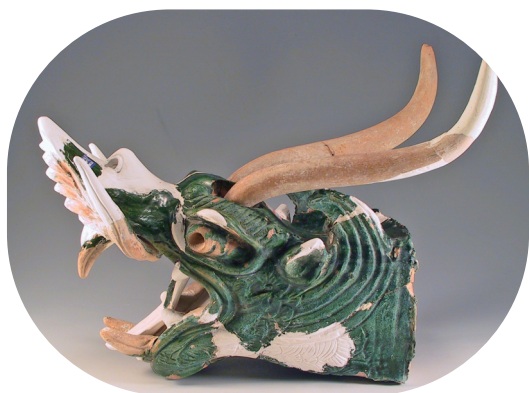
遗址出土的西夏绿釉套兽。

在文化遗产保护理念方面,陈同滨提出了许多深刻见解。她认为:“申遗固然重要,但更重要的是做好自己的事情——尽可能地研究、保护、管理和阐释中华民族的文化遗产,让文化遗产更好地为支撑一个民族的文化自信服务。”在她看来,世界遗产申报不是最终目的,而是推动文化遗产保护、研究和价值传播的重要手段。通过申遗过程,可以促进国际社会对中国文化遗产的了解和认同,同时也帮助我们更清晰地认识自身文明在人类文明发展史上的特性和贡献。