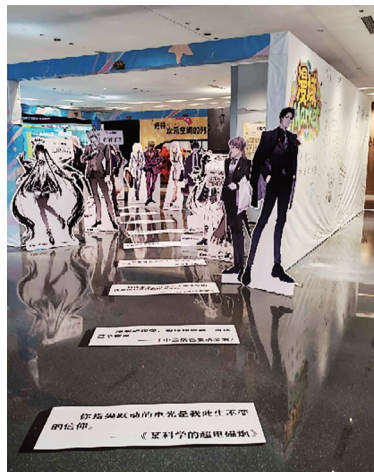
漫域 Market 入口处。

建发现代城四楼的漫域 Market 街区，一踏进去就仿佛跨进了次元之门。大型动漫角色立牌错落排列，从华丽裙装到帅气西装，将虚拟角色的魅力凝练成实体；地面上，《某科学的超电磁炮》中“你指尖跃动的电光，是我此生不变的信仰”、《中二病也要谈恋爱》里“爆裂吧现实，粉碎吧精神，放逐这个世界”等经典台词依次铺展，熟悉的文字像一把钥匙，瞬间唤醒漫迷的记忆。背景墙上“漫域 Market”的字样与角色插画交相辉映，上方“通往次元空间的列车”标语更添奇幻感——这里用视觉与文字，为每一位爱好者编织了一场沉浸式的初遇。