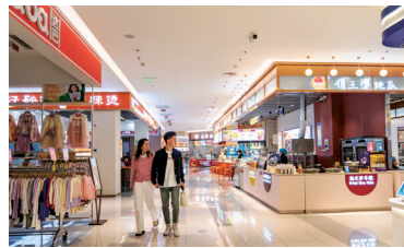
贺兰县将投放近3000笔闪付优惠以刺激消费。

早在8月22日,贺兰县全民庆丰收促消费活动已率先启动。活动期间,县域内投放近3000笔闪付优惠——市民仅需7.7元即可抢购100元优惠券,优惠范围覆盖百货、零售、