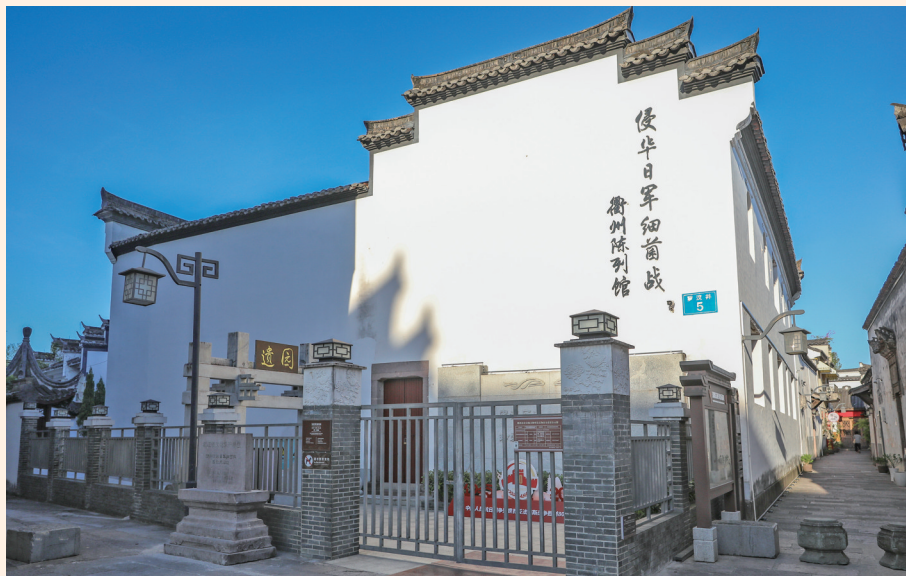
这是8月17日在浙江省衢州市拍摄的侵华日军细菌战衢州陈列馆。