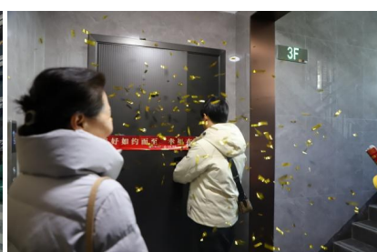
中海观园交付现场照片。

间。值得关注的是,项目特别推出“一对一专属管家”服务,由专业人员全程陪同业主验房,针对房屋细节、设备使用规范、后期维保流程等问题进行细致解答。同时,现场配备了总包、精装、园林等多专业快修团队,对业主提出的细微问题实现即时响应、快速整改,用专业高效的服务让收房过程更安心、更省心。“从园区环境到房屋细节,再到工作人员的服务态度,都超出了我的预期,冬天收房能有这样的体验很暖心。”现场一位完