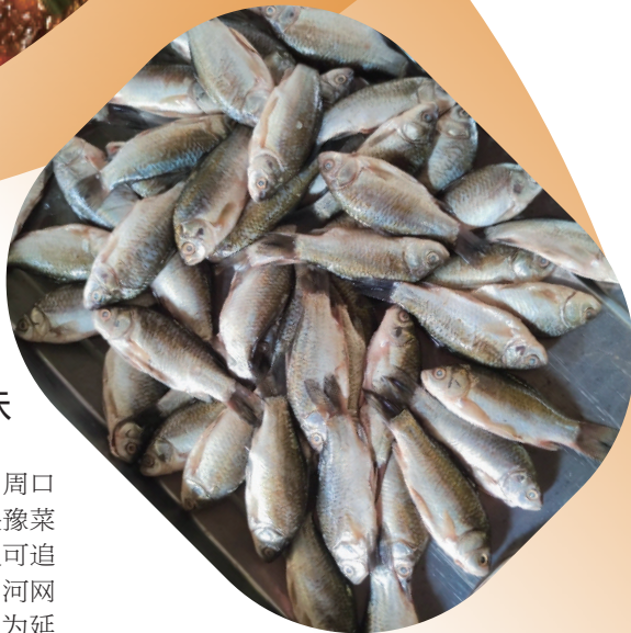
做糟鱼最好用小鱼。

选好鱼后,需按传统方法处理:只去除内脏,特意保留鱼鳞和鱼鳃。“很多人觉得鱼鳞、鱼鳃脏,其实这是风味的关键。鱼鳞富含胶质,炖煮后会融入汤汁,让口感更醇厚;鱼鳃则能增添独特的鲜香,这是老一辈传下来的智慧。”处理干净的鱼需用流水反复冲洗,再摊在通风处彻底晾干。“鱼身不能带一点水,否则下油锅会溅,还影响鱼肉紧实度。”