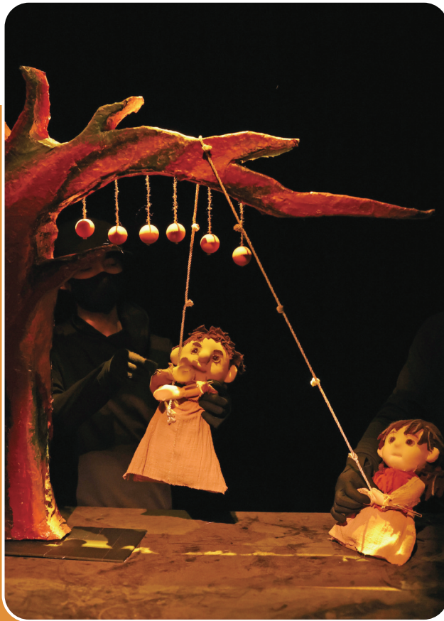
《数星星的孩子》演出现场。

他最终选择以偶剧这一“最简单的表现手法”来呈现故事。此前两版更偏向话剧的文学剧本被推翻,因为他发现“无法用人或舞美填满书中真正打动我的部分”。偶剧看似简单,却能通过细腻的动作传递复杂情绪,让观众在简约的画面中看见自己的记忆与柔软情感。最终,当代偶剧《数星星的孩子》呈现出一个质朴的故事——舞台上的草垛、星星、山川与羊群如散文诗般流淌,讲述孩子们在温情乡村中成长的故事,展现童年的天真与坚韧。这不仅是单一作品的诞生,更是为宁夏戏剧创作从深厚的地方文学中汲取养分、开拓题材,提供了一个具体的实践案例。