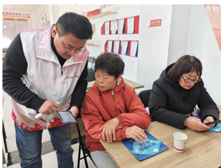
“智慧助老课堂”开讲。