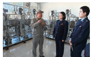
银川税务推动诚信纳税。

从地方制药厂成长为现代化医药集团，宁夏启元药业有限公司以自身实践证明了诚信纳税与企业发