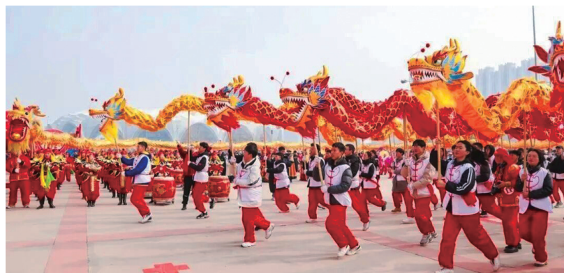
不断练习,精进技艺。

封路提醒:为保障活动安全有序开展,对亲水大街沈阳路至亲水大街哈尔滨路段双向进行临时管控,管控时间为3月1日15:00~17:00,以上区域管控期间禁止车辆通行,请提前规划绕行路线。