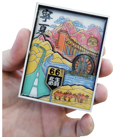
宁夏主题文创冰箱贴。

行走在宁夏的文化地标里，文创更像一段流动的叙事。贺兰山岩画把“岁月失语，惟石能言”的厚重，化作太阳神风暴瓶、岩画图腾钥匙扣，让远古图腾轻轻落在身边。西夏陵则以极简克制的设计，将雄浑古陵藏进帆布包、西夏文象棋、金盏托冰箱贴，不张扬、不喧闹，却自带沉静的历史分量。