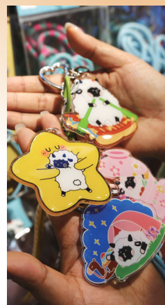
卡通滩羊造型亚克力钥匙扣。