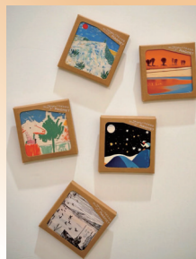
宁夏故事陶瓷冰箱贴。