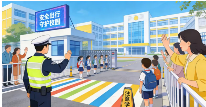
制图:梁惠琴 (AI辅助生成)

区月牙湖中学等校园周边路口,信号灯启用分时段运行模式。高峰时段严格执行行人过街绿灯通行,全力保障学生安全;无过街需求时段切换至黄闪运行,合理释放通行能力,兼顾安全与效率。