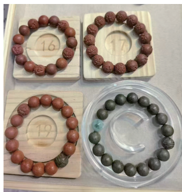
经过装饰的成品香珠。