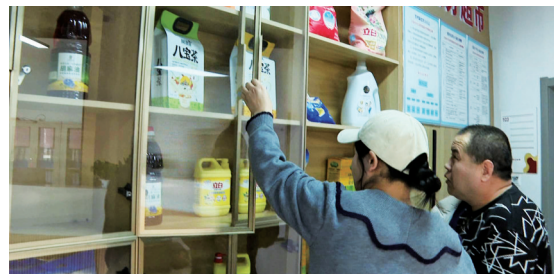
积分制赋能乡村治理。

在泾龙村积分超市,各类生活用品摆放有序,村民通过参与环境整治、美丽庭院创建、公益服务等文明实践积攒积分,凭积分即可兑换相应物品,让文明行为得到实实在在的激励。在实践中,泾龙村不