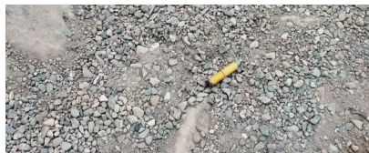
景区路面上掉落的烟头。