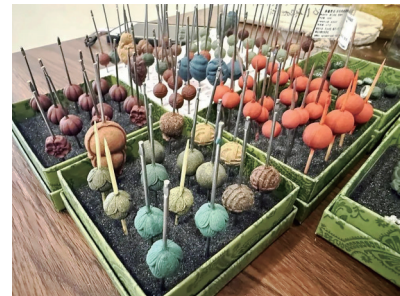
阴干的中药香珠。资料图片

需要明确的是,中药手串更多在于情绪价值和心理慰藉,药用价值比较有限。吕沛宛表示,通过皮肤浅层接触和偶尔嗅闻所摄入的药物成分较为微量,对人体的调节作用有限。若有疾病症状,仍需前往医院接受规范治疗。