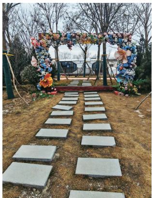
专门为打卡设置的背景装置。