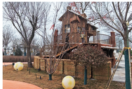
古朴原始风格的房屋,其实是咖啡吧。