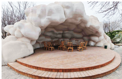
云朵造型的小屋,也是打卡点之一。

最近,位于银川市兴庆区掌政镇洼路村的“那块田·北典农城研学聚落”在网络上火起来了。这里以汉代北典农城的屯垦历史为魂,以黄河农耕文化为脉络,把塞上田园的美景和研学实践的趣味结合在一起,既有千年历史的厚重感,又有亲子互动的鲜活气,四季风光各有不同,成了银川市民短途微度假、青少年研学实践的好去处。