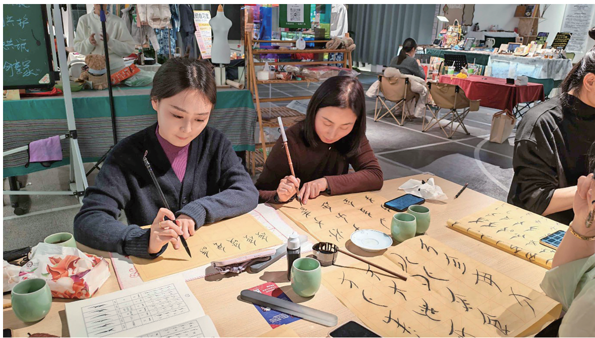
体验书写江永女书。

近日，一场沉浸式的江永女书体验活动在银川温情开展，不少文化爱好者相聚一堂，认识女书、学习书写，感受这份国家级非物质文化遗产的独特魅力，让古老的女书文字在指尖流淌，在新时代焕发出新的光彩。