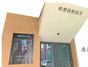
怀远书房活动现场。