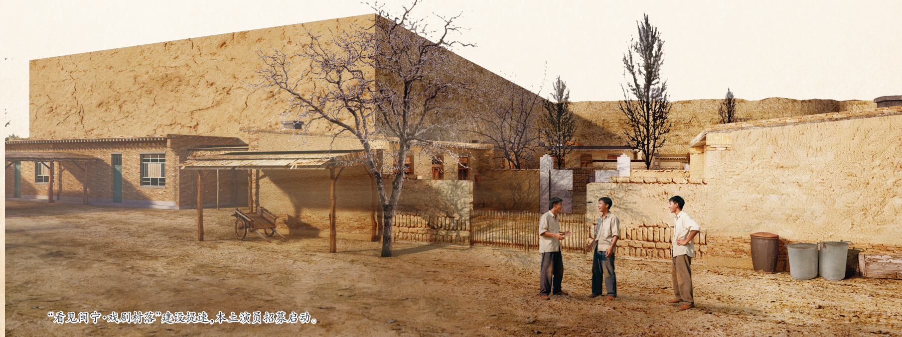
“看见阅宁·戏剧村落”建设提速,本土演员招募启动。

据了解,金凤区二十八小是一所九年一贯制学校,位于金凤区六盘山路以南、高桥街以东、凤仪路以北、丽银街以西,目前已完成总工程量的75%,计划今年7月交付使用。项目建成后,将有效缓解金凤区南部片区义务教育资源紧张问题,让更多适龄儿童在家门口享受优质均衡的教育。