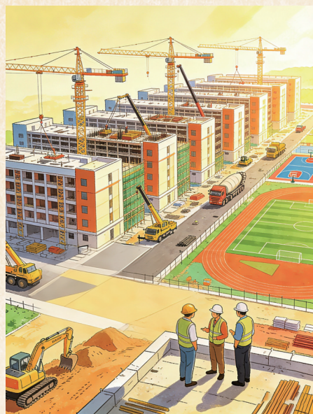
制图:徐文燕(AI辅助生成)