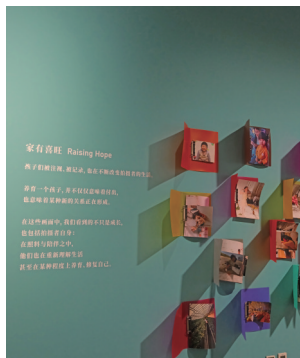
“家有喜旺”影像展区。

还有一些超级有趣的照片。比如，路边大树上突然“长”出的大眼睛，把风都吹得调皮起来，偷贴了假睫毛的蜡笔小新玩偶，成了水杯界慵懒又精致的显眼包；还有老爸试戴小熊帽子的搞怪模样、弟弟给姐姐消毒上药的暖心时刻……这些没有专业构图、没有精致修图的画面，是高中生放学路上抬头撞见的晚霞，是异乡人初到银川尝到的第一份牛肉饼香气，是宠物趴在窗台等主人回家的温柔守候。它们不是为展览而生的作品，只是普通人随手拍下的生活切片，却在美术馆的空间里，完成了从私人记忆到公共艺术的温柔蜕变。