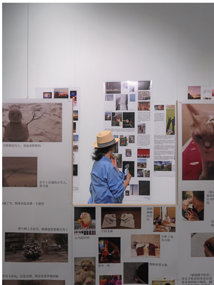
观看普通人的日常影像。