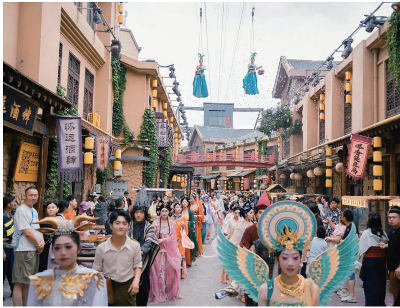
“看见贺兰”沉浸式演艺小镇。

4月8日，位于贺兰山下的“看见贺兰”沉浸式演艺小镇正式发布3.0版本招商计划。该项目以“看见贺兰·文脉共生”为核心主题，创新推出“零租金”品牌扶持模式，重点面向宁夏“六优六特”产业开放9组核心商业点位，旨在通过“演艺+文化+产业”的深度融合，降低本土优质品牌准入门槛，探索文旅商业新模式。