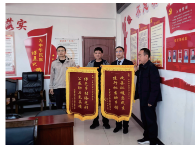
隆德县观庄乡向自治区扶贫基金会与建行宁夏区分行赠送锦旗。

夏扶贫基金会的感谢之情，观庄乡和中梁村代表全体村民，现场送上锦旗，鲜红的锦旗承载着村民最质朴、最真挚的谢意，成为这场爱心帮扶活动最温暖的见证。