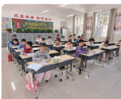
作文比赛现场。

据了解,本次大赛由银川市新闻传媒发展有限公司、银川市作家协会主办,银川市金凤区外国语实验小学、灵武市教师培训和教学研究中心、灵武市作家协会承办,新百中心协办。赛事以文学为纽带,将传承黄河文化、厚植家国情怀作为核心主旨,同时聚焦青少年语文素养提升,致力于激发广大中小学生阅读与写作兴趣,全面锤炼语言表达与文字创作能力,践行“以读促写、以写润心”的育人理念。在赛题设计上,大赛紧密结合语文新课标要求,精心打造贴合青少年生活实际、兼具深厚文化内涵与鲜明时代