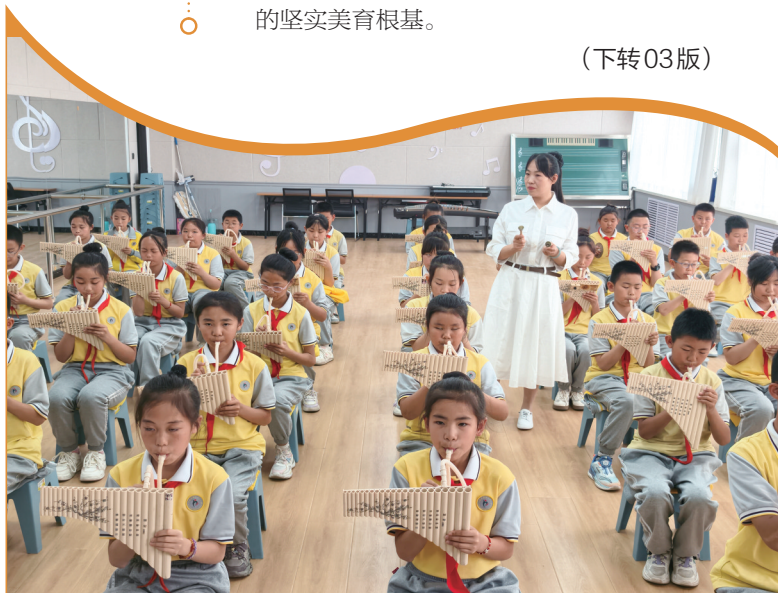
兴庆区第二十三小学景福校区的学生学排箫。