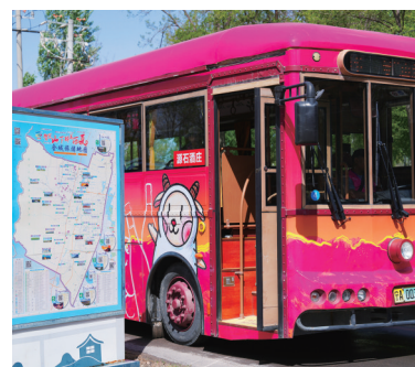
贺兰山东麓红酒巴士。

本报讯(记者 李阳阳)4月24日,贺兰山东麓红酒巴士首发暨红酒文化中心揭牌仪式在西夏区镇北堡镇昊苑村格莉其酒庄举行。首批红酒巴士缓缓驶出酒庄,车身以贺兰山东麓葡萄酒园风光为底色,点缀着红酒元素,兼具观赏性与辨识度,成为一道流动的“紫色风景线”。现场工作人员向乘客们详细介绍了沿途酒庄、景区,让乘客沉浸式感受“车在景中走,人在画中游,酒香伴旅途”的独特文旅线路。