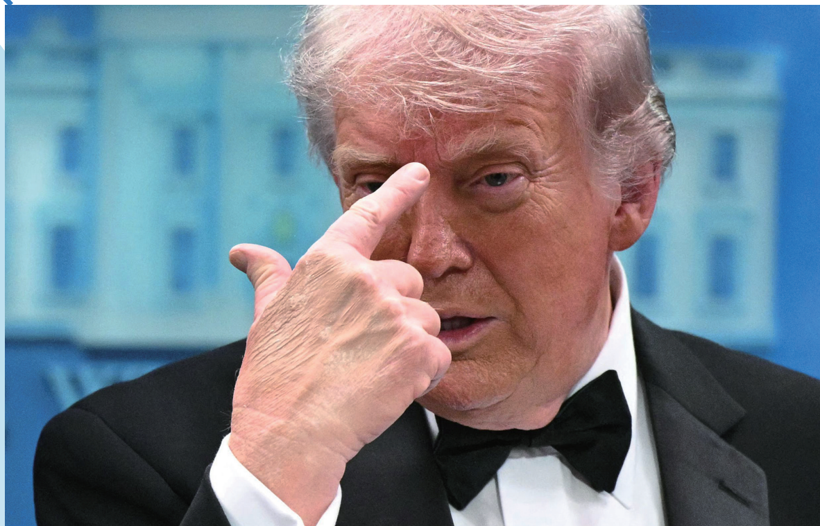
4月25日，美国总统特朗普在华盛顿白宫新闻发布会上讲话。