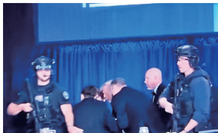
这张4月25日拍摄的视频截图显示，美国总统特朗普在华盛顿白宫记者协会晚宴发生“安全事件”时在安保人员护送下离开。