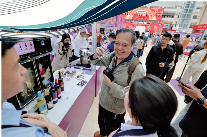
游客在美食集市品葡萄酒。

随着“五一”假期到来，贺兰山东麓酒庄集群消费市场持续火热。银川紧扣产区特色优势，深耕假日文旅经济，以葡萄酒为纽带，串联酒庄度假、街头市集、近郊漫游、户外休闲多种业态。山野有葡园风情，城里有酒香烟火，多元的酒旅场景，既丰富了市民假日生活，也实实在在带热了近郊出游，激活了全城春日消费活力。